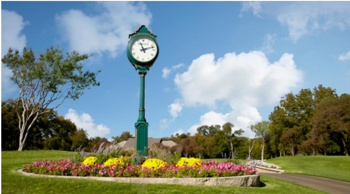
Ornamen Taman – Garden Clock – Jam Taman Kota

Jika Anda melihat taman kota pada umumnya, apa saja yang bisa Anda temukan, umumnya bisa menemukan bunga dan tanaman hias, serta lampu lampu. Memang terlihat indah dipandang, namun akan terlihat kurang hidup dan artistik bila tidak ditambah dengan ornamen lainnya. Dalam hal ini JAM TAMAN KOTA bisa memberikan warna lain untuk keindahan dan manfaat lebih kepada masyarakat yang melintasi taman tersebut.